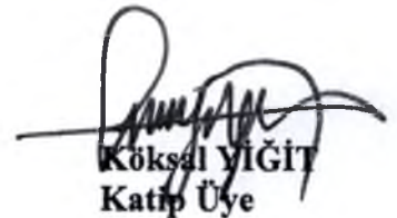
Köksal YİĞİT Katip Üye