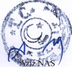
Aziz NAS Belediye Başkanı