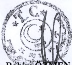
Rahim ÖZMEN Belediye Başkanı Vekili

Belediye Meclisininin 03/06/2022 tarihli toplantısında oy birliği ile karar verilmiştir.