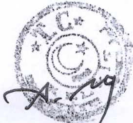
Aziz NAS Belediye Başkanı

Belediye Meclisinin 07/09/2022 tarihli toplantısında oy birliği ile karar verilmiştir.